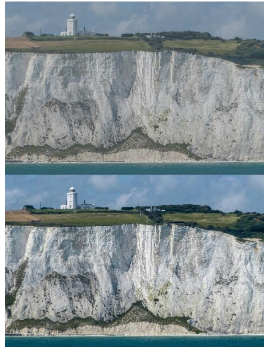
Figure 2 - La même image, avant et après ajustement automatique.

Les yeux rouges sont un phénomène photographique disgracieux qui se produit lorsqu'une lumière forte, comme celle d'un flash, se reflète dans les vaisseaux sanguins des yeux du sujet. Cet effet est très facile à corriger avec un logiciel d'édition d'image.